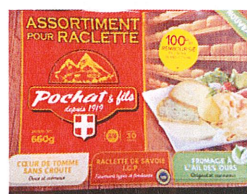
Raclette plateau 660gr