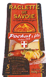
Raclette tranche 360gr