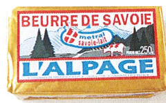
Beurre de Savoie