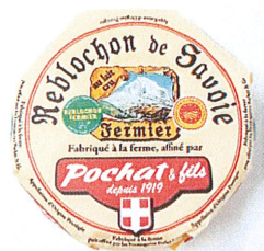
Petit reblochon fermier