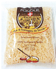
Râpé 4 fromage